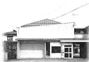
👉リフォーム前の事務所