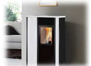
ペレットストーブ ドイツ製