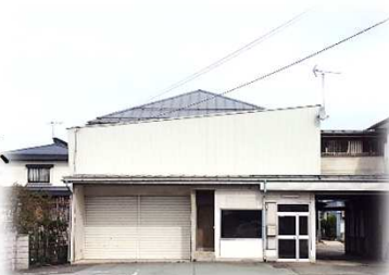
👉リフォーム前の事務所

私達はリフォーム工事もやらせていただいております。最近はずいぶんリフォーム工事も多くなってきていますね。